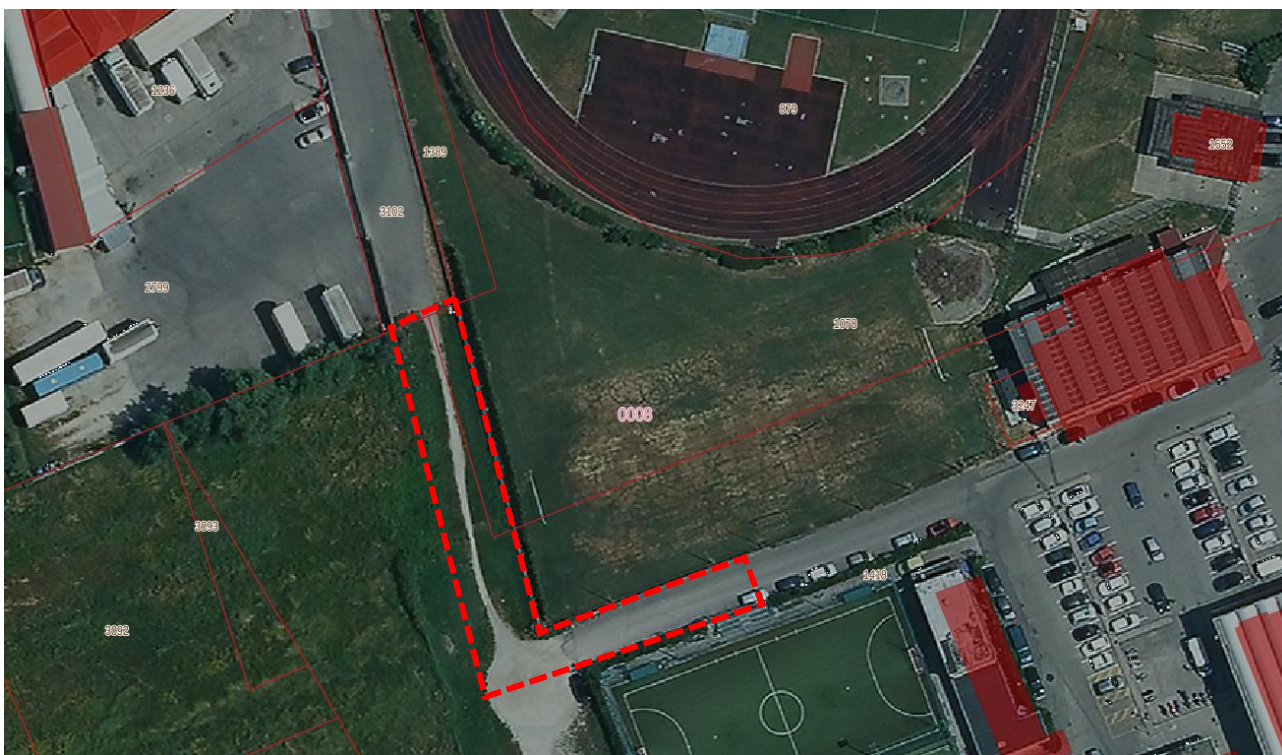
Figura 1 – Area interessata dalle lavorazioni

L'intervento ricade catastalmente all'interno del Foglio 8 del Comune di Monsummano Terme (PT).