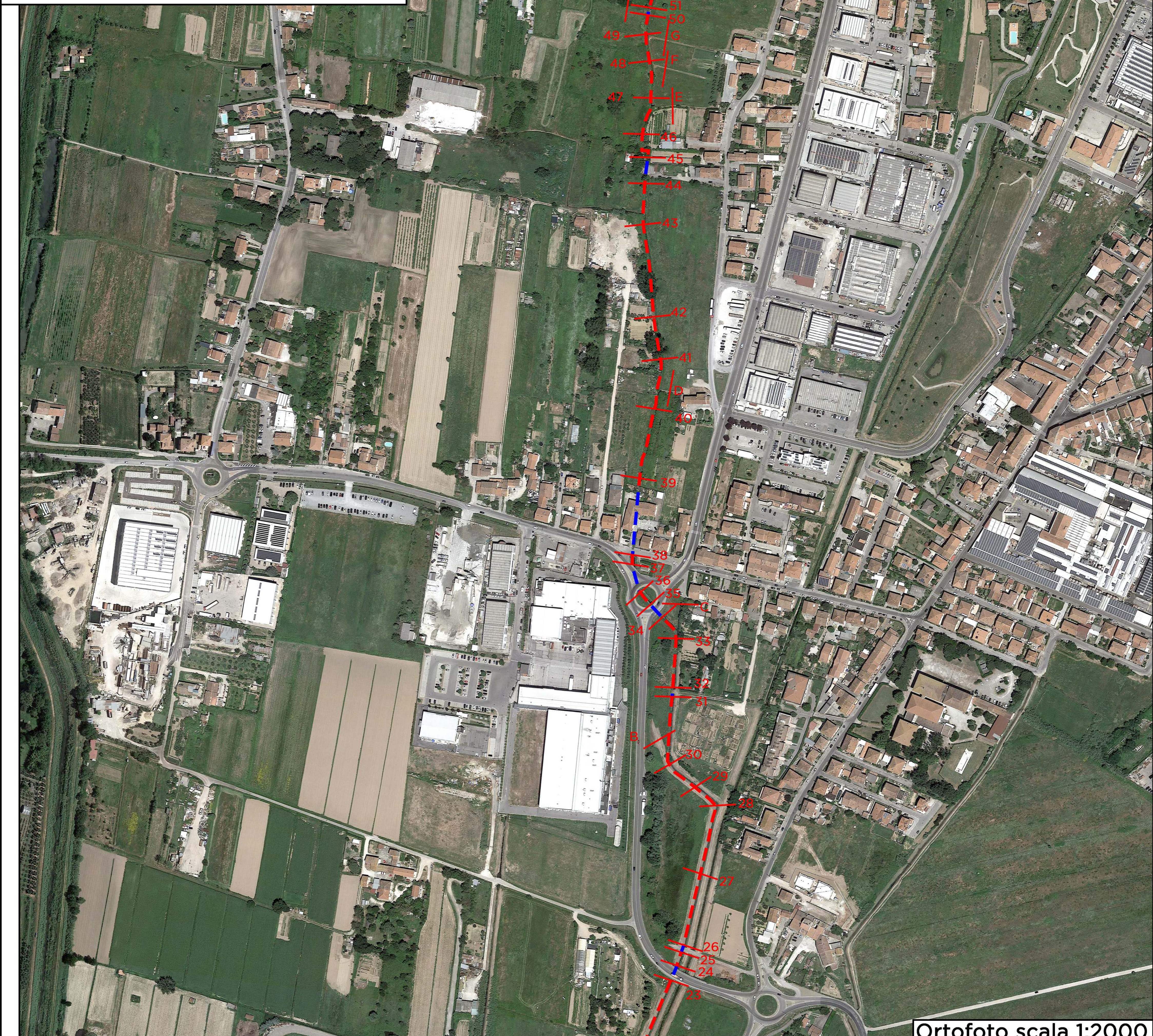
Ortofoto scala 1:2000